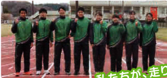
全国を舞台に活躍する選手たち