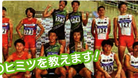
男子リレーチーム(2018全日本実業団4×100mR優勝)